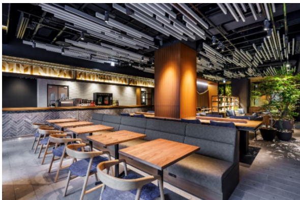
▲エントランスラウンジ

※1：2024年3月、東京・上野に開業したレジデンシャルホテル「&Here（アンドヒア）」の第1号ホテル https://www.nskre.co.jp/company/news/2024/03/docs/20240313.pdf